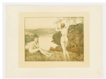
↗ René Ménard (*Paris 1827 - † Paris 1887), Lithograph Herbst , 1897