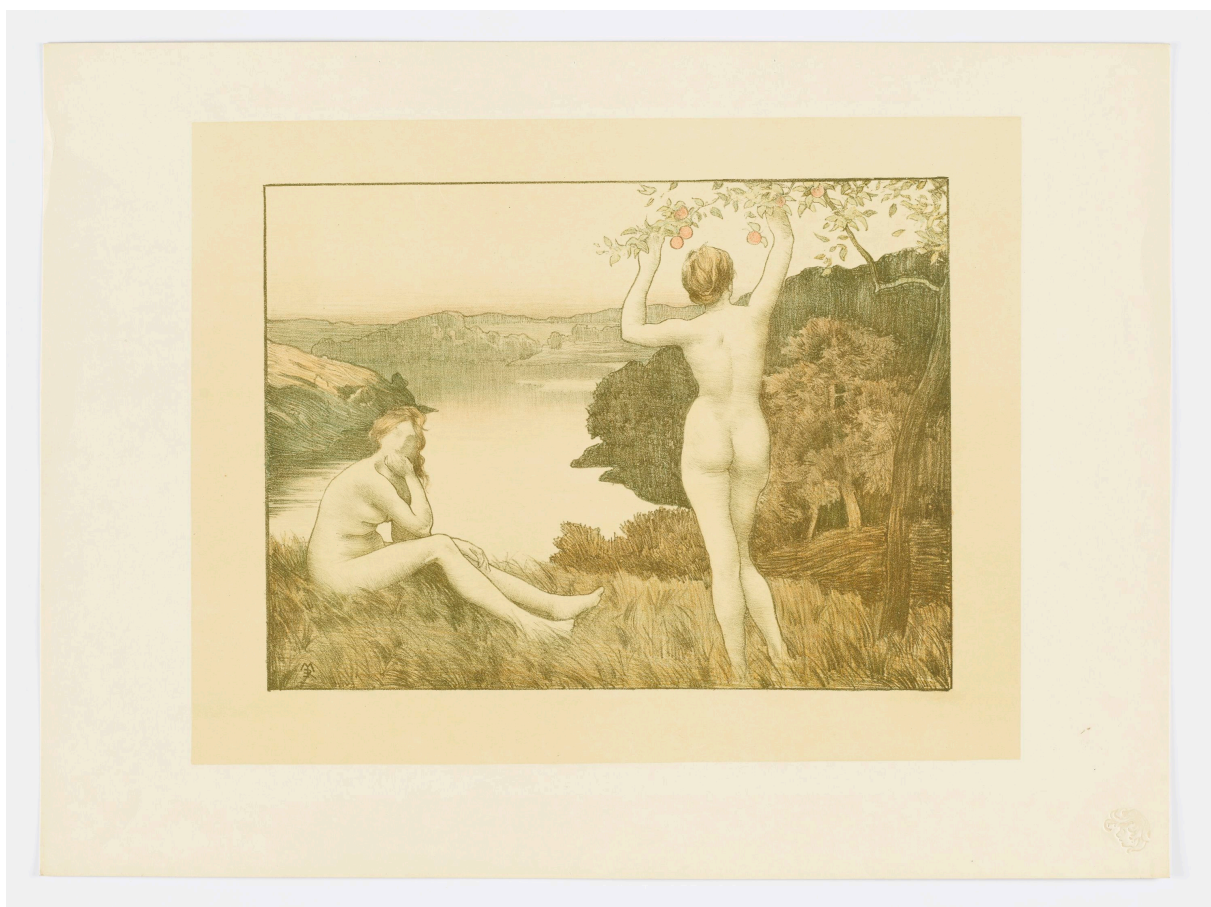
➤ René Ménard (*Paris 1827 - † Paris 1887), Lithograph Herbst , 1897