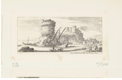
↗ Israël Silvestre (*Nancy 1621 - † Paris 1691), Radierer Civitavecchia, Blatt 12 der Folge "Antiche e moderne vedute di Romæ" , 1650