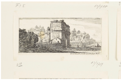
↗ Israël Silvestre (*Nancy 1621 - † Paris 1691), Radierer Konstantinsbogen, Blatt 10 der Folge "Antiche e moderne vedute di Romæ" , 1650