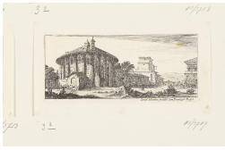
↗ Israël Silvestre (*Nancy 1621 - † Paris 1691), Radierer Tempel des Sol, Blatt 2 der Folge "Antiche e moderne vedute di Romæ" , 1650