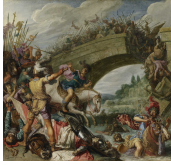
↗ Pieter Lastman (*Amsterdam 1583 - † Amsterdam 1633), Maler Schlacht zwischen Konstantin und Maxentius , 1613