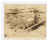
↗ Norbert Goeneutte (*Paris 1854 - † Auvers-sur-Oise 1894), Radierer Panorama der Rance in Dinan , 1892