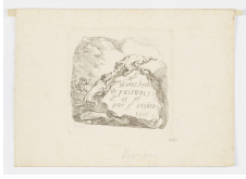
↗ Ignace Duvivier (*Rians/Var oder Marseille 1758 - † Paris oder Reims 1832), Radierer Kämpfende Hunde, Titelblatt aus: "Divers sujets de paysages", 1800