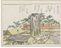
↗ Katsushika Hokusai (*Edo 1760 - † 1849), Formschneider Jahrmarkt in Asakusa , 1775-1849