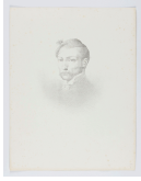
↗ Léon Cogniet (*1794 - † 1880), Lithograph Bildnis Théodore Géricault , 1824