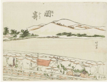
↗ Katsushika Hokusai (*Edo 1760 - † 1849), Formschneider Station Okazaki, Blatt 39 der Folge "53 Stationen des Tōkaidō" , um 1804–1806